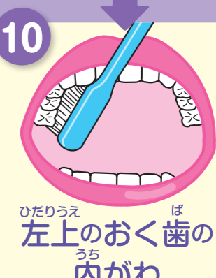
ひだりうえ ば 左上のおく歯の内がわ