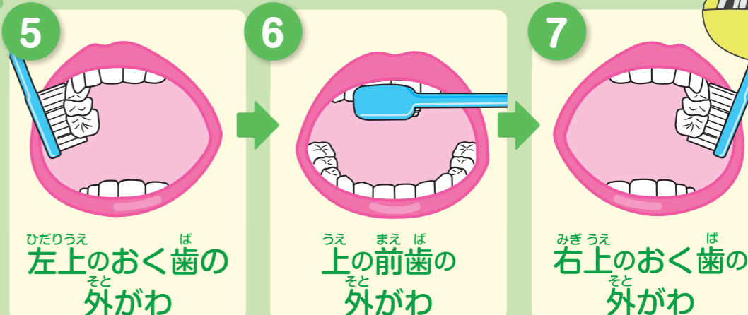
ひだりうえ ば 左上のおく歯の外がわ