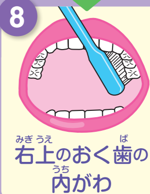
みぎうえ ば 右上のおく歯の内がわ