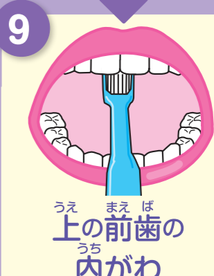
うえ まえ ば 上の前歯の内がわ