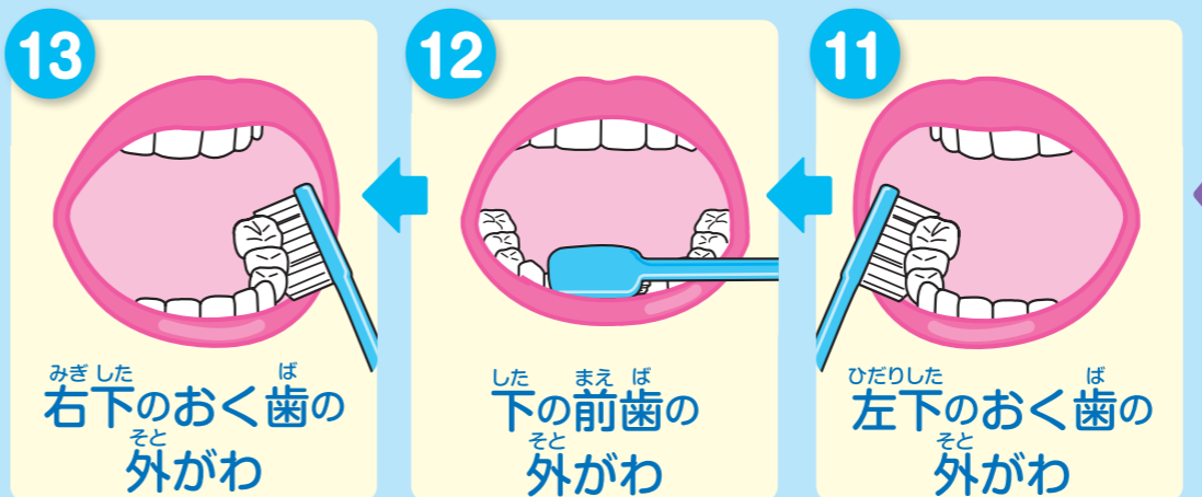
みぎした ば 右下のおく歯の外がわ