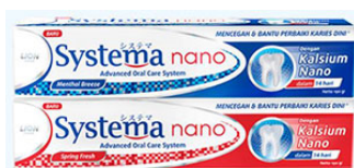
インドネシアで販売するSystema ハミガキ