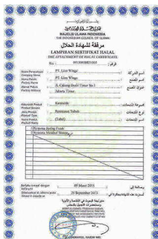
インドネシアのハラール認証