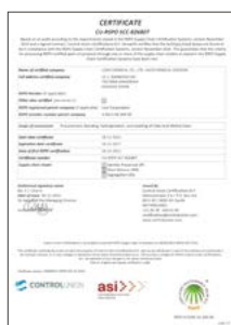
ライオンケミカル(株)のRSPOサプライチェーン認証