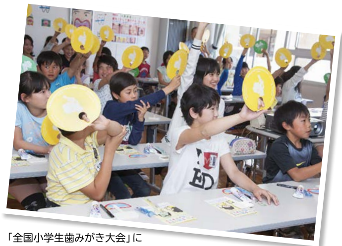
「全国小学生歯みがき大会」に参加した小学校

当社は、「企業活動で得た利益を社会に還元する」という創業当時から一貫した理念のもとに、1913年から口腔保健の普及・啓発活動を行ってきました。1964年に厚生省（当時）認可の財団法人ライオン歯科衛生研究所(LDH)を設立し、2010年には内閣府から公益財団法人への移行認定を受け、公益財団法人としてスタートしました。LDHは引き続き、日本歯科医師会、大学、行政などと連携しながら下記の3つの公益事業を通じ、生活者の歯と口の健康を保持増進し、すべての人々の生活の質の向上に結びつけられるよう口腔保健の最前線で社会に貢献しています。当社はその活動を全面的に支援しています。