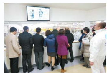
小田原工場の工場見学の様子