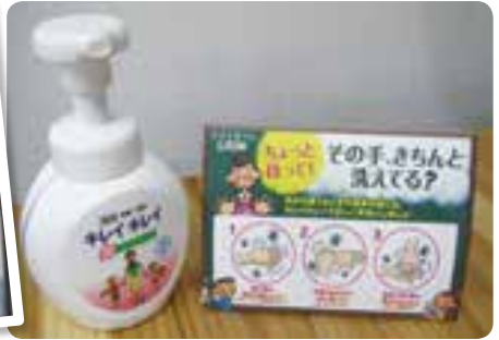
アテンションツール

幼稚園・保育所、小・中学校、公共施設などに『キレイキレイ泡ハンドソープ』を設置するとともに、手洗いポスターやアテンションツールを提供しています。