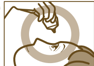
容器の先を下に向けて点眼