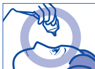
容器の先を下に向けて点眼