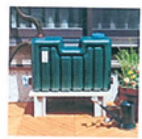
ミツギロン 雨水タンク50L 8,700円(税込) 送料別