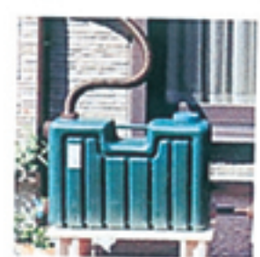
ミツギロン 雨水タンク50L(連結用) 8,390円(税込) 送料別