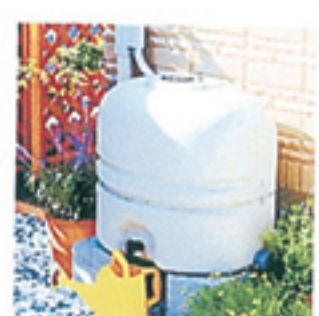
パナソニック雨水タンク 雨ためま 専科 定価38,225円(税込)のところ 29,800円(税込) 送料込