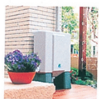
【送料無料!!】セクスィエクステリア レインポッド 57,500円(税込) 送料込