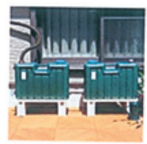
ミツギロン 雨水タンク100L 15,960円(税込) 送料別