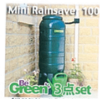
【送料無料&代引発送無料】 BeGreen英国製雨水タンク★ミニ レインセーバー100(3点セット)★ 今なら設置工具プレゼント! 15,750円(税込) 送料込