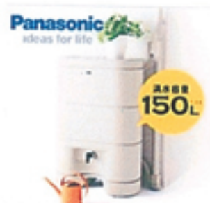
【送料無料】パナソニック電気雨水タンク★レインセラー150★(税 どい接続キット付属) 定価63,000円(税込)のところ 54,800円(税込) 送料込