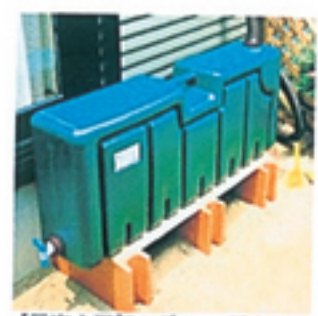
【限定企画】ミツギロン 雨水タンク200L 送料無料!! 定価15,750円(税込)のところ 9,980円(税込) 送料込