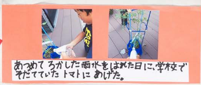
あつめてろかした雨水をはれた日に、学友で そだてていたトマトにあげた。