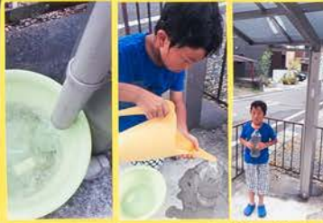
雨どいからたくさん水が出た。ジョーロにうつしてペットボトルにこめた。