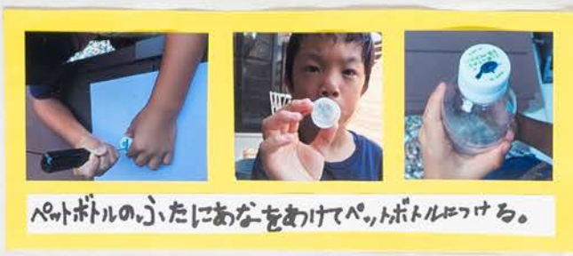
ペットボトルのふたにあなをあけて、ペットボトルをつくる。

ダムのように雨水をためて、きたなかっ た水は、じょう水場のよう「ろか」 してつかうことができた。ダムのように、水をたくさんためておけ ば、水ぶそくにな、ても大じょうぶだおもった。