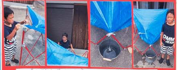
タープのほねぐみにブルーシートをかぶせシートにおちる雨をバケツでうけとる