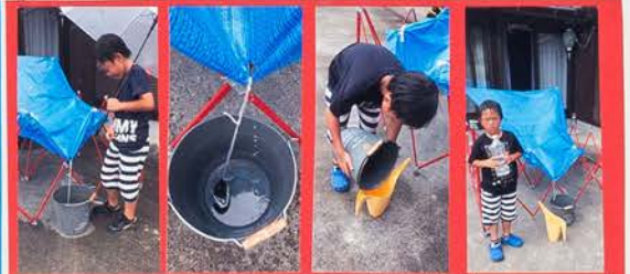
雨がふってもさしよはなかなかバケツにおちてこなかった。日時間がたつとあつまった。