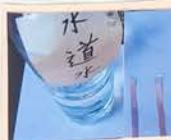
水道水はどちらでもない

つかったもの、リトマスしけんし リトマスしけんしとは、さんせい、て、赤、アルカリせい、で、青になる紙。水のせいしつがわかる。