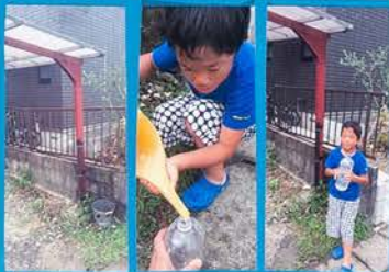
やねのいろいろなところから雨が落ちてきた。バケツでとれるようにした。