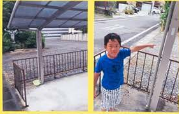
雨どいの出口の水をせんめんきでとる