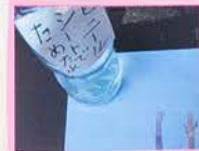
雨水は少し赤(少しさんせい)