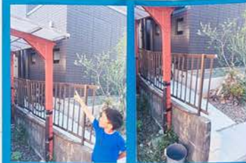
やねからおちてくる水をバケツでうけとる