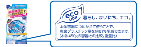
「トップスーパー-NANOX」つめかえ

当社は、生活者に商品を通じて環境配慮の重要性を啓発するため、製品ライフサイクルの視点から評価項目を設定した当社独自の「ライオン エコ基準」をクリアした商品に、「環境ロゴ」と環境に配慮した理由を併記した「環境ラベル」を2014年より付与しています。